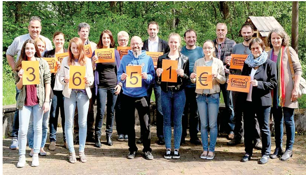
In einer Austausch- und Feierrunde wurde Ende April im Amt für Kinder, Jugend und Familie der »Scheck« in Höhe von 3.651 Euro aus der Aktion »Mitmachen Ehrensache« übergeben.