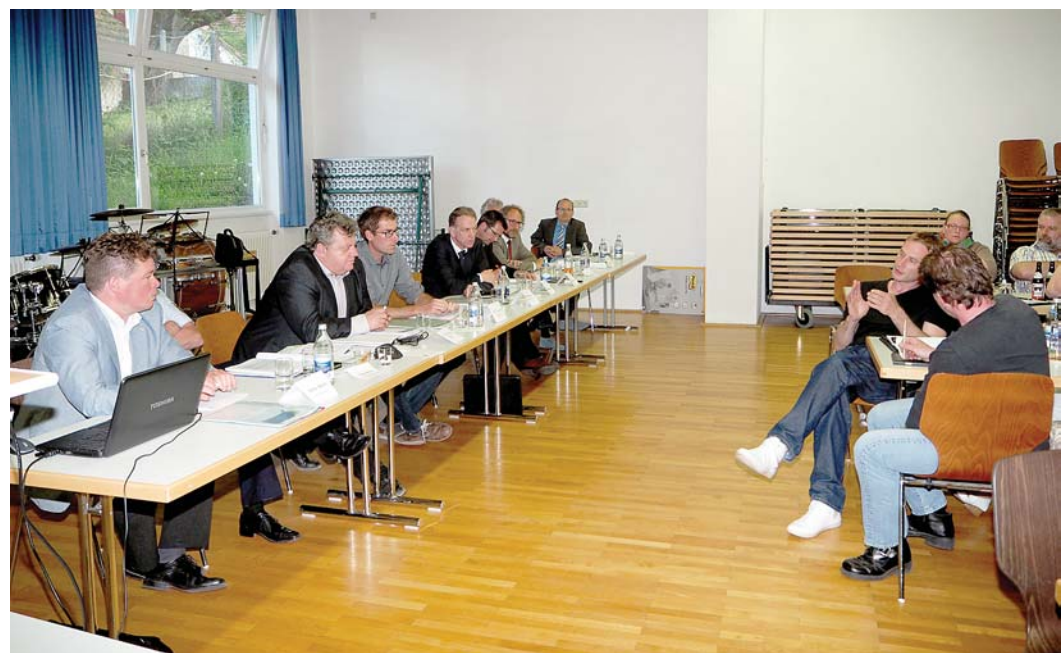
Mit Vertretern des Landratsamtes, des Regierungspräsidiums und der Stadt diskutierten die Bargaer Bürger in der vergangenen Woche. Thema war die Sanierungsmaßnahme an der Ortsdurchfahrt und die Verkehrsbelastung allgemein.