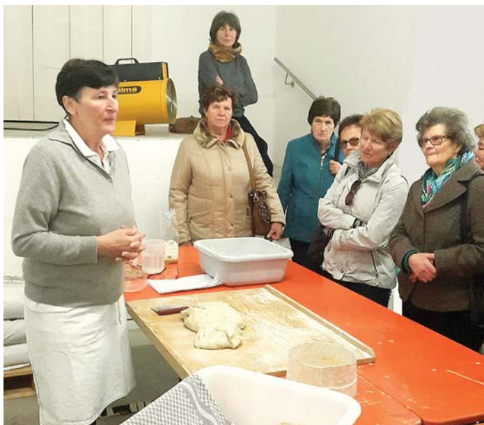
Interessiert verfolgten die Landfrauen Stockach-Engen beim Besuch der Blattertmühle im Rahmen des Jahresausflugs die Backvorführung durch die Seniorchefin.

Weiter ging es über Lörrach ins Rheintal zum Betrieb Fünfschilling nach Fischingen. Nach einem schmackhaften regionalen Mittagessen in modernem Ambiente übernahm im Anschluss der Seniorchef die Führung durch den Betrieb. Bauernladen, Hofcafé, Backstube und Gemüsehandel in XXL-Version beeindruckten alle Mitreisenden. Der Betrieb Fünfschilling hat viele Schweizer Kunden aufgrund der Grenz Nähe, und neben den Familienarbeitskräften managen