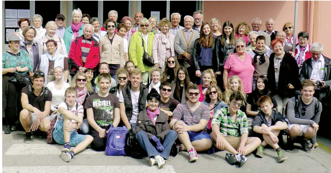
Fünf Tage mit Konzerten, Auftritten, Besichtigungen, Landeserkundungen und interessanten Begegnungen mit der italienischen Bevölkerung erlebten der Stadtchor Engen und das Vokalensemble »Philia« in Engens Partnerstadt Moneglia. Eine gelungene Reise, die mit Musik und ausgesuchtem Gesang einen wertvollen Beitrag zur Völkerverständigung leistete.